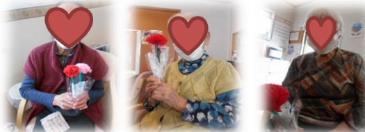
母の日に職員から手づくりプレゼントをさせて頂きました。