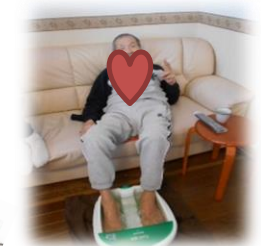
足湯・マッサージをされて「気持ちがいいね」とスマイル

今後も体調確認させて頂きながら、感染対策を継続し皆さんに楽しんで頂けるようご支援させて頂きます。