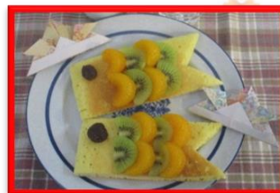
美味しいこのほいで子供の日をお祝い！

足こぎの運動で下肢筋力の強化も図り、全身運動にもなります。夜間の良眠にも繋がりますね。