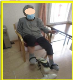
足こぎの機械で全身運動！

活字を読む事で目から入る情報をしっかり脳に伝え、考える力、創造する力、映像にする力を引き出していきます。利用者様だけでなく私達にも必要な事ですね。