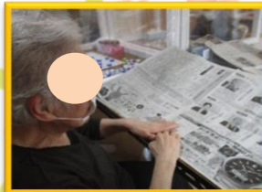
新聞を読んで脳活性！

活字を読む事で目から入る情報をしっかり脳に伝え、考える力、創造する力、映像にする力を引き出していきます。利用者様だけでなく私達にも必要な事ですね。